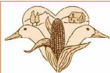
La ferme La Motte

Quand la passion d'un potier prend toutes ses lettres de noblesse. Quand l'argile rencontre ses doigts pour devenir une pièce de poterie. Quand son art décoratif s'exprime par le pinceau et la poire. Alors, nous sommes au cœur d'une Terre de Tradition.